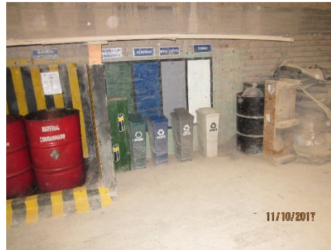
Fotografías Nos. 8 y 9. Sociedad Ladrillera Prisma S.A.S. Se aprecian los compartimientos de disposición de los residuos peligrosos y domésticos.