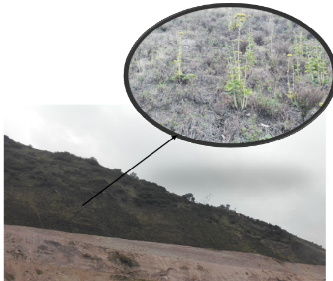
Fotografía No. 16. Sociedad Ladrillera Prisma S.A.S. Presencia de Kalanchoe sp , en las zonas empedradas del módulo 2 de Ladrillera Prisma S.A.S , esta especie se puede considerar invasora no obstante , en esta etapa de la sucesión natural provee al talud recuperado cobertura y material orgánico para la conformación de suelo.