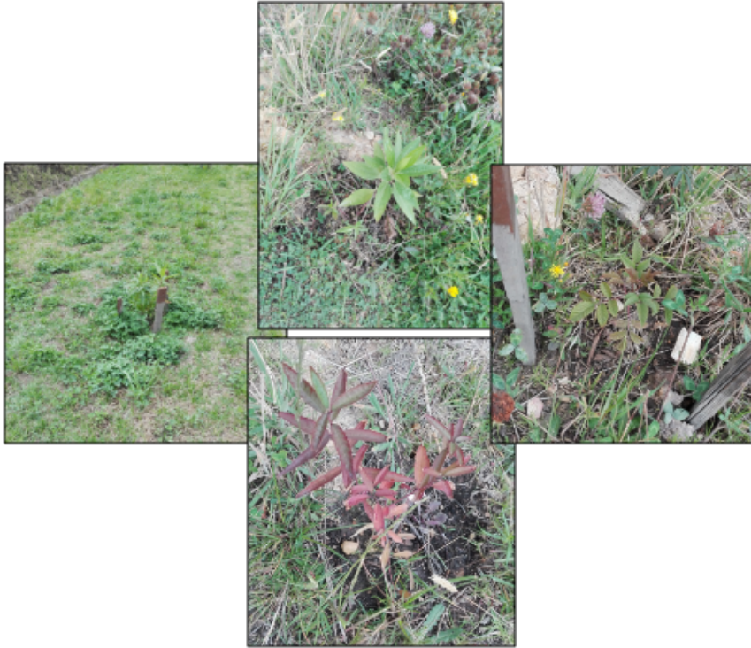
Fotografía No. 17. Siembra de especies nativas de Baccharis latifolia , Dodonea viscosa en berma