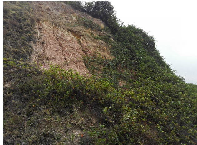
Fotografía No. 15. Sociedad Ladrillera Prisma S.A.S. Avance de la zona con cobertura vegetal natural de bejuco colorado Muehlenbeckia tamnifolia noviembre 2017