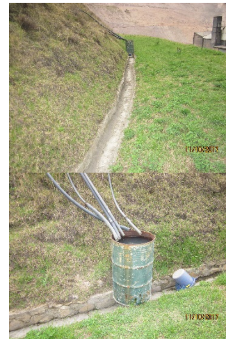
Fotografías Nos. 3 y 4. Sociedad Ladrillera Prisma S.A.S. Se aprecian los drenes instalados en los taludes finales y revegetalizados, para verificar el caudal arrojado y controlar la estabilidad de los taludes