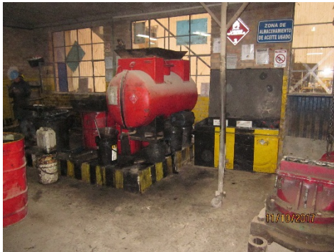
Fotografía No. 10. Sociedad Ladrillera Prisma S.A.S. Se aprecia la zona para el manejo de los aceites usados.