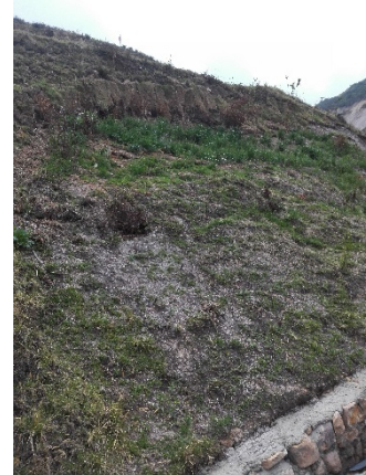
Fotografías Nos. 12 y 13. Sociedad Ladrillera Prisma S.A.S. Zonas afectadas por procesos de remoción, en la cuales se lleva a cabo procesos de empradización con semillas de pasto kikuyo Pennisetum clandestinum