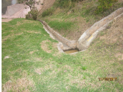
Fotografías Nos. 5, 6 y 7. Sociedad Ladrillera Prisma S.A.S. Se aprecia la cuneta y desarenador en buen estado de funcionamiento.