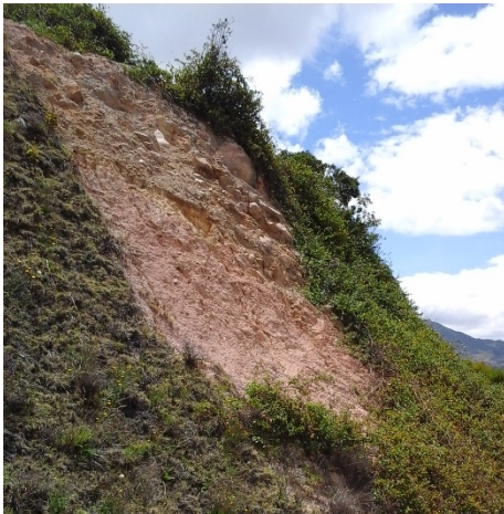
Fotografía No. 14. Sociedad Ladrillera Prisma S.A.S. Avance de la zona con cobertura vegetal natural de bejuco colorado Muehlenbeckia tamnifolia octubre de 2016