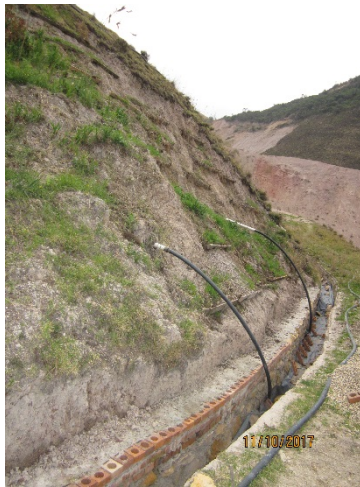
Fotografía No. 2. Sociedad Ladrillera Prisma S.A.S. Se aprecia los dos drenes instalados en la berma 2 del cierre sur y los trinchos construidos, con el fin de evitar el desprendimiento del material vegetal en el talud 1 del citado sector.