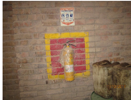
Fotografía No. 11. Sociedad Ladrillera Prisma S.A.S. Se aprecia uno de los extintores con su aviso informativo