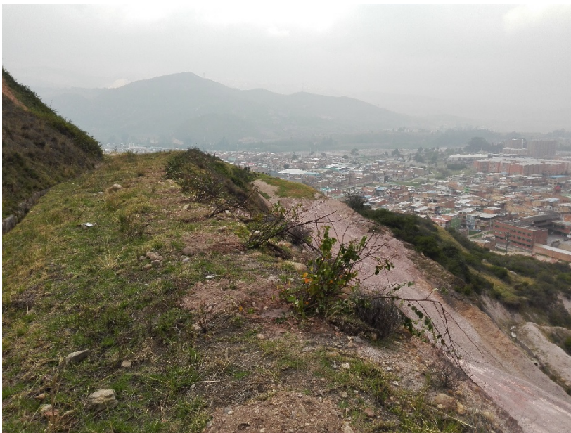
Fotografía No. 18 Siembra de Muehlenbeckia tamnifolia en bermas del módulo 2